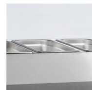
Geschikt voor GN1/4 bak(ken) (niet meegeleverd)