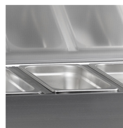
Geschikt voor GN1/3 bak(ken) (niet meegeleverd)