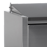
Roestvast stalen deksel voor bescherming van voedsel