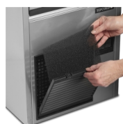
Gemakkelijk te reinigen condensfilter