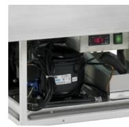
Automatische verdamping van dooiwater